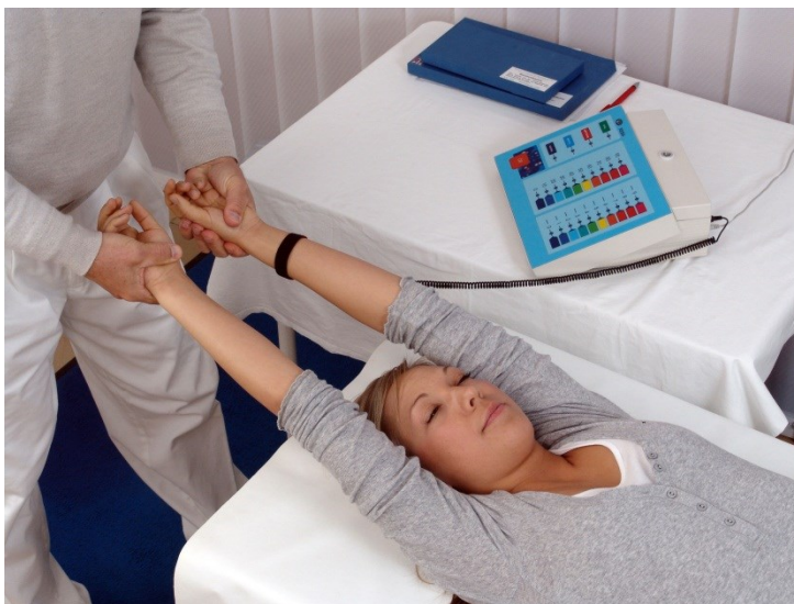
Afbeelding 1 Typische testsituatie bij PSE: kinesiologische armlengte test met het Reba-Testgerät, om de waarden van de vier fijn-materiële energie-bereiken te testen.

Uit ervaring blijkt, dat men juist door een gebrek aan fijn-materiële energie zijn dagelijks leven soms niet meer in de hand heeft. Bij kinderen uit het zich vaak in concentratie verstroringen, gebrek aan belangstelling voor de school en het ontbreken aan doorzettingsvermogen. Men bemerkt bij hen een gebrek aan opvoeding, verschillende